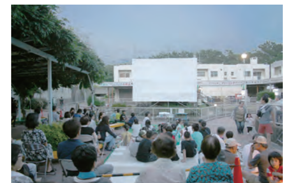
平成 26 年度 野外こども映画会の様子