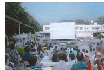
平成26年度 野外子ども映画会の様子